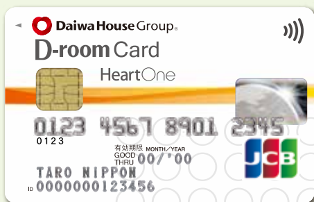
( VISA / JCB )