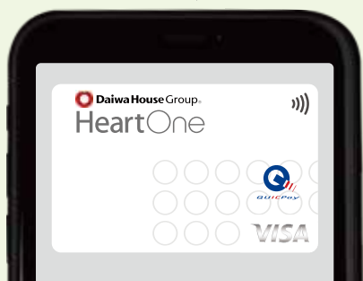
( VISA / JCB / AMEX )

スマートフォンに設定したクレジットカードに付帯の クイックペイでのお支払いも対象となります。